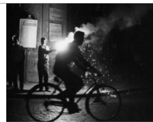
New York, 1955

Tirage gélatino-argentique moderne signé par l'artiste Dimensions du tirage : 30 x 40 cm