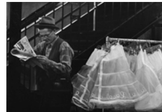
Lower East Side, New York, 1955

Tirage gélatino-argentique d'époque, réalisé et signé au dos par l'artiste Dimensions du tirage : 22,5 x 29 cm