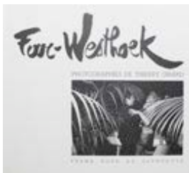
Far-Westhoek, Zuydcoote, 1982 ( texte de l'auteur ).