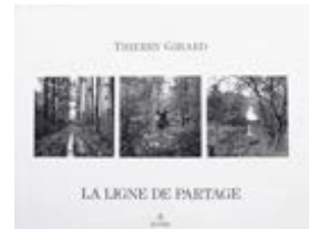
La Ligne de partage Paris : Admira, 1988 ( textes de Bernard Weber et Vincent Cordebard ).