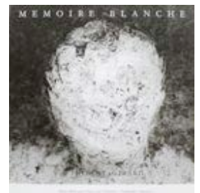
Mémoire blanche Charleville : Musée Rimbaud-Musée de l'Ardenne, 1993 ( texte de l'auteur ).

Paris : C. Geiss éd. 1990 ( texte de Raymond Bozier ).