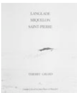
Langlade, Miquelon, Saint-Pierre Saint-Pierre et Miquelon : Centre Culturel, 1994 ( texte de l'auteur ).